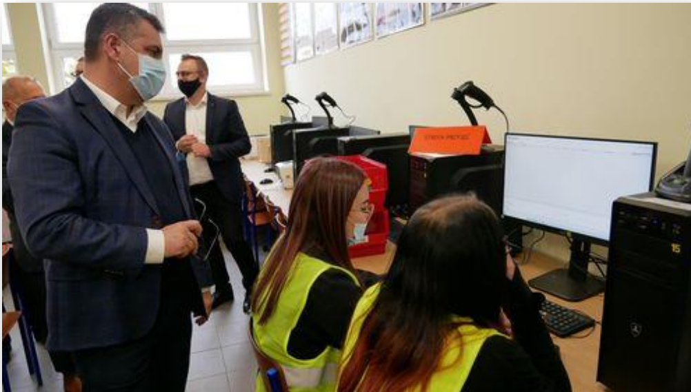
Otwarcie pracowni logistyki w CKZiU w 2021 roku.