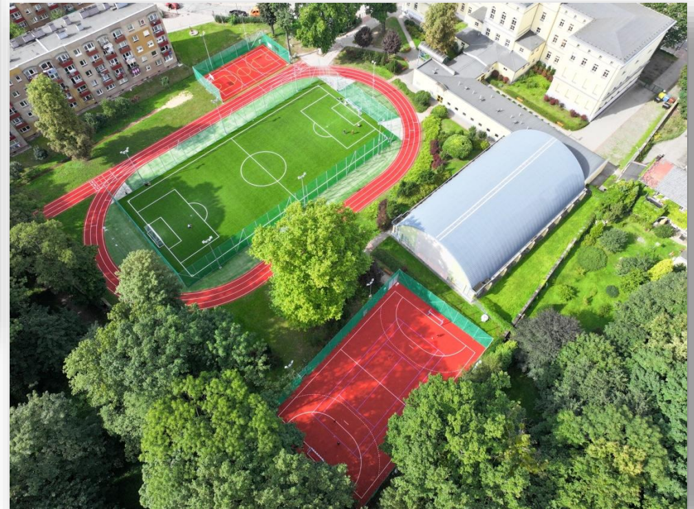
„Nowoczesna modernizacja wielofunkcyjnego kompleksu sportowego przy Liceum Ogólnokształcącym z Oddziałami Dwujęzycznymi w Strzelcach Opolskich”.