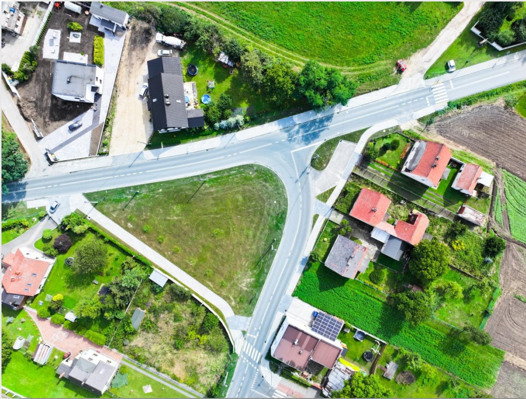
Rozbudowa układu komunikacyjnego ulic Kozielskiej, Dolińskiej i Mickiewicza w Strzelcach Op.