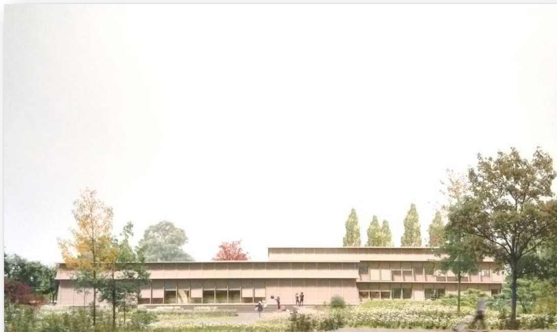
Koncepcja architektoniczno-urbanistyczna Centrum Edukacji i Wsparcia Dziecka oraz Rodziny.